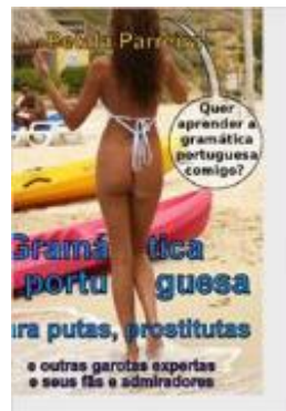
• Gramática portuguesa para putas